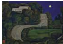
高山辰雄「暮小径」 1950年代後半