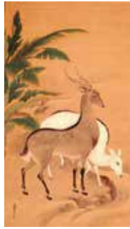
狩野典信「遊鹿図」 17世紀後半~18世紀初め