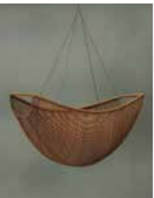
生野祥雲斎 「入船投入籠」 1934年