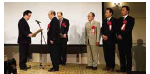
「協働のまちづくり大賞」表彰式の様子

「下郡っ子いきいき倶楽部」が選ばれました。表彰式後、事例発表が行われ、明野南町自治会では、自治会を挙げて行った廃品回収の財源で水銀防犯灯を3年間でLED灯に更新し、資源の有効活用と省エネの相乗効果を図る活動が紹介されました。今回、惜しくも選考にもれた団体も含め、いずれも素晴らしい取り組みであるとの報告を受けています。今後も「市民協働のまちづくり」が各地域の新たな試みを通して、さらに深化していくことを期待しています。