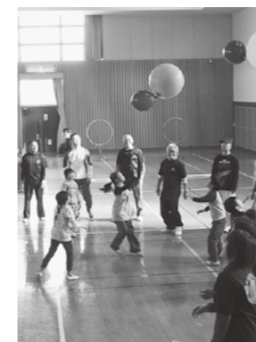
総合型地域スポーツクラブの活動

未来を担う子どもたちの、豊かな人間性をはぐくむとともに、すべての市民が文化・芸術に触れ、スポーツに親しむなど、自らを高めいきいきと充実した人生を送ることができるまちづくりを進めます。