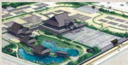
▲大友氏館跡の立体復元イメージ図

お問い合わせ 大分生活文化展実行委員会事務局(商工労政課内) ☎537-5959