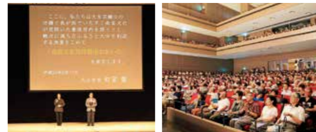
上智学院理事長 高祖 敏明氏