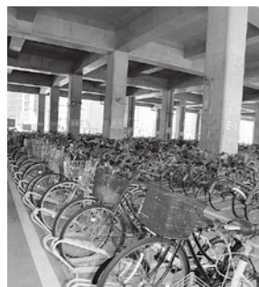
大分駅高架下東駐輪場

各地域の現況や特性に配慮し、総合的かつ計画的な市街地の整備を進めるとともに、交通体系の確立や住環境の質的向上、情報通信基盤の整備、ライフラインの安定的確保などにより、人にやさしい快適な生活を支えるまちづくりを進めます。