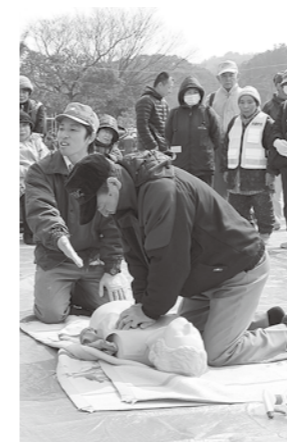
自主防災組織の訓練

地震・台風などの自然災害をはじめ、日常生活に潜むあらゆる危険性から市民の生命と財産を守るため、市民、地域、行政および関係機関が協働し、安心・安全に暮らせるまちの実現をめざします。