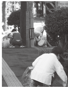
ボランティアによるごみ拾い

豊かな自然を守りながら、自然と調和した魅力ある環境づくりを推進するとともに、清潔で安全に暮らせる快適な生活環境を構築するため、市民、事業者、行政が連携して、環境に優しい循環型社会の実現をめざします。