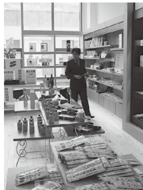
中国武漢市にある大分産品のアンテナショップ

経済を活性化し雇用機会を創出するなど、地域の発展を支える各種産業の振興を図るとともに、そこに住む人や訪れる人々にとって魅力ある地域づくりを推進し、にぎわいと活力に満ちた豊かなまちづくりを進めます。