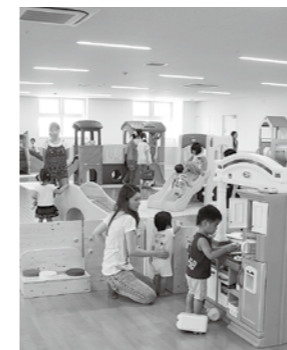
中央こどもルーム

市民一人ひとりが、人権を尊重し、この住み慣れた地域で生きがいを持って安心して、健やかでいきいきと暮らしていける地域社会をつくりまします。