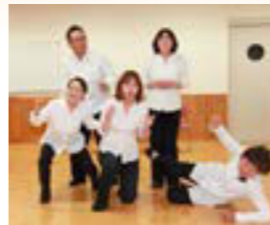
プレイバックシアターONCE

「プレイバックシアター」。それは、台本なしの即興劇。観覧に集まった人たちに子育てで感じたことや体験談などを語ってもらい、その場でアクター(役者)が再現します。第三者が表現することで、客観的に日ごろの子育てを見つめることができ、新たな発見をしたり、子育ての喜びや悩みなどを分かち合ったりすることができます。 市では子育て支援にプレイバックシアターを取り入れ、23年度に「アクター養成講座」を開催。その修了者により、劇団「プレイバックシアターONCE(ワンス)」が結成され、希望する団体での公演や、練習の公開などを行っています。 「プレイバックシアター」を、体験してみませんか。