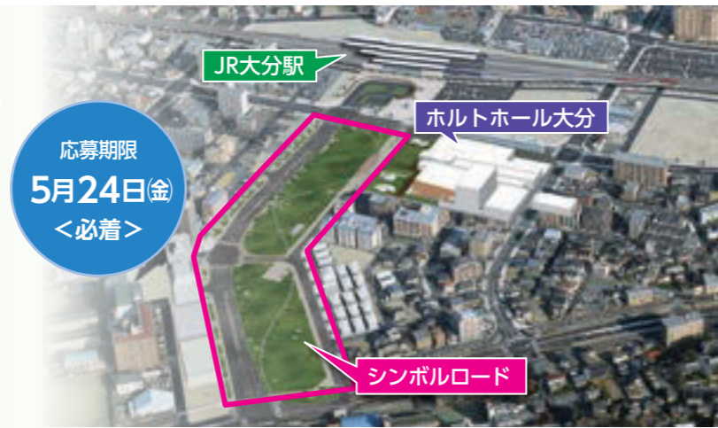
シンボルロード完成予想図

JR大分駅と市美術館がある上野の森を結ぶ「シンボルロード」。26年春の完成を予定しており、3月の市民植樹祭で芝生を植え付けた北側部分は、7月20日(土)のホルトホール大分のオープンに併せて、利用を開始します。 市民の皆さんに親しみと誇りをもって利用してもらえよう、愛称を募集します。