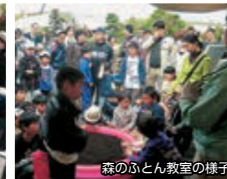
森のふとん教室の様子