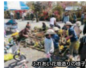
ふれあい花壇造りの様子