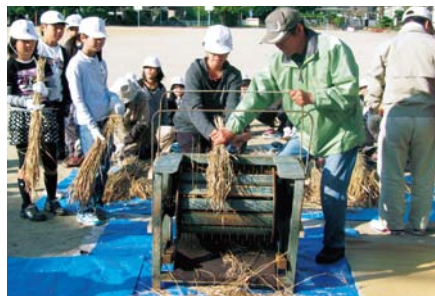
昔の農機具を使った農業体験教室の様子