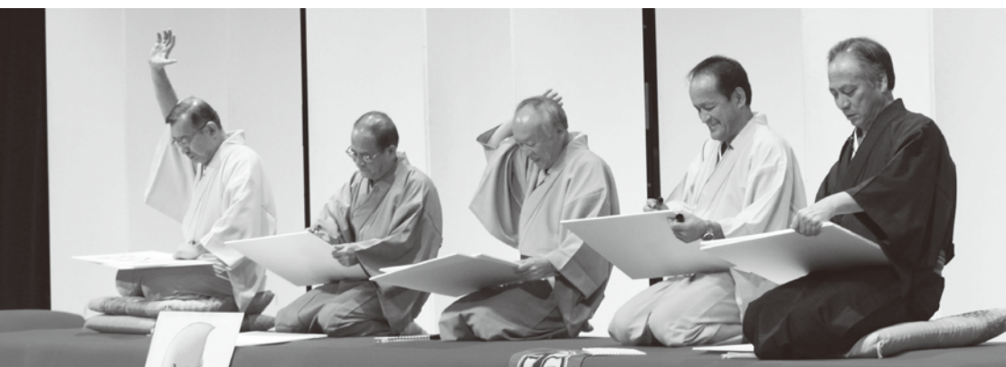
歳末たすけあい興行チャリティーショー