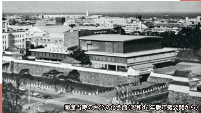
開館当時の大分文化会館(昭和41年版市勢要覧から)

昭和41年10月12日に誕生した大分文化会館。以来、多くの皆さんに親しまれてきました。10月31日(木)をもって閉館し、その歴史に幕を下ろすこととなりました。大分文化会館の最後のステージを市民の皆さんの手で飾っていただくため、大ホールで公演をする団体を募集します。