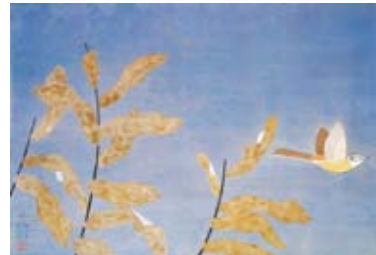
福田平八郎「暖冬」1952年頃