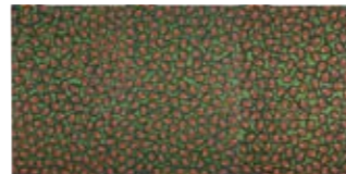
草間彌生「生命への畏敬」1989年