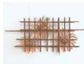
生野祥雲齋「乱菊」1964年