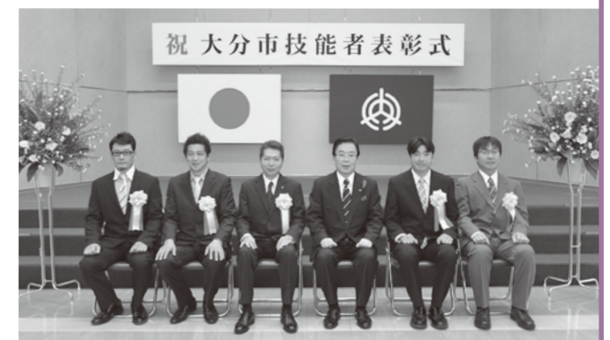
祝 大分市技能者表彰式

身が納得できるものを提供したいと常に心掛けています。 パソコンの普及やペーパーレス化で印鑑の需要が減少し、そのことで技術者が減り、後継者の育成も難しい状況です。 手彫りの印鑑の良さをPRしていくことで、新たな需要を開拓したいと考えています。 わたしの一本一本手彫りした印鑑を大切に使用していただければ、これ以上の幸せはないと思います。 今回の受賞を励みに、より一層努力していこうと思います。