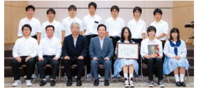
「第36回全国高等学校総合文化祭」 自然科学部門 化学分野の研究発表で最優秀賞 大分県立大分上野丘高等学校 化学部