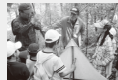
身近な自然観察会