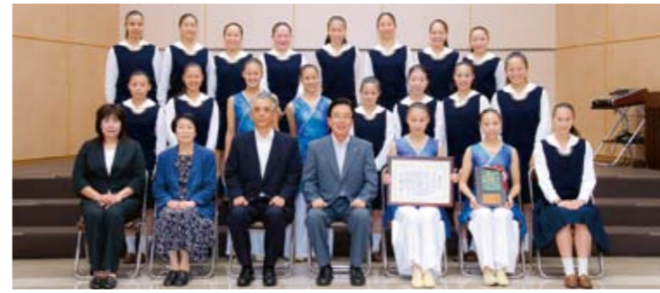
「第36回全国高等学校総合文化祭」 マーチングバンド・バトントワリング部門 バトンの部で講評者特別賞 大分東明高等学校 バトントワリング部