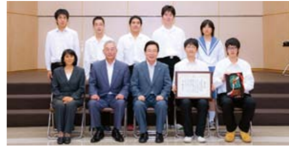
「第36回全国高等学校総合文化祭」 自然科学部門 ポスター(パネル)発表で最優秀賞・文部科学大臣賞 大分県立大分舞鶴高等学校 科学部生物班