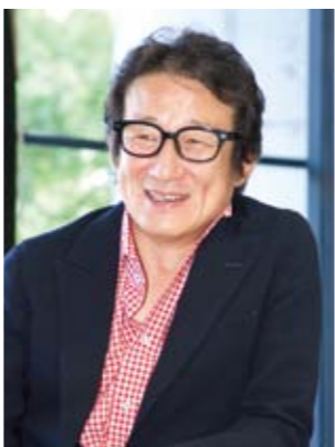
水田 伸生 監督

1958年生まれ、広島県出身。'05年放送文化基金賞受賞。映画監督としてのデビュー後、『舞妓Haaaaan!!!』('07)などで新しいエンターテインメント作品を作り上げ、多彩な才能を発揮している。