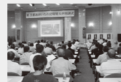
おおいた市民環境大学