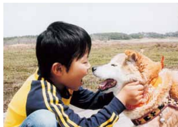
第25回 愛犬・愛猫との写真コンテスト 金賞