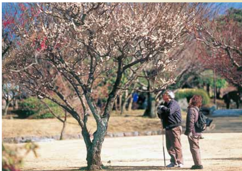
2011 人権フォトコンテスト 最優秀賞「春が来た」

例えば… ●家族の大切な(絆)を実感したときにこぼれる涙 ●苦労や努力が報われたときの喜びの涙 ●あきらめずに挑戦しようとする決意の涙 ●悔しい気持ちを抑えきれない怒りの涙 ●人の身勝手な行為により自然が泣いているような情景 など