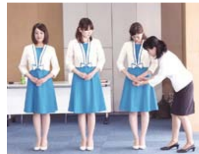
研修で講師から美しい立ち姿を習う様子