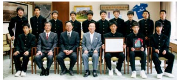
「第7回春の全国中学生ハンドボール選手権大会」 男子の部で優勝 市立滝尾中学校 男子ハンドボール部