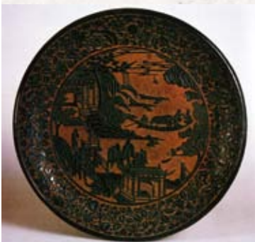
赤壁賦図盆 (名古屋・政秀寺蔵/) 信長が天下人になる以前に宗麟が贈った漆製のお盆。

このように宗麟は、将軍家や信長、秀吉などの有力武将と緊密な連携をとるなど、中央の動きを探るための情報ネットワークを構築し、地域国家(豊後を含めた北部九州6か国)の建設に尽力しました。こうした点にも、卓越した宗麟の政治力をうかがうことができます。