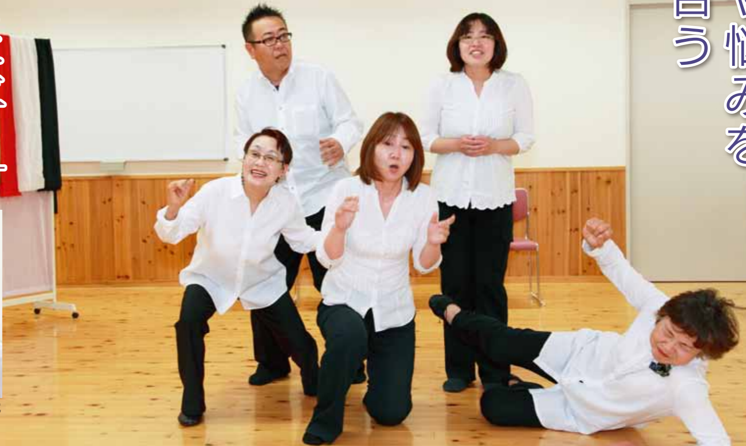
プレイバックシアターONCE プレイバックシアター「アクター養成講座」の修了者により24年4月に結成。現在、団員35人。24年度は、市内の各地域での公演やワークショップの開催を予定しています。

自分で決めて演じる。一度きりのその場限りの演技は、日常では味わえない緊張感があります。『プレイバックシアター』のことを知ったのは、わたしが所属する子育てサークルの紹介でワークショップに参加したことが始まり。父親としての子育てに生かせるとの思いからでした。「こんなに面白い活動があったんだ」。演劇のことを全く知らないわたしでも、毎回楽しく練習することができました。 多くの人に『プレイバックシアター』の魅力を知ってほしいと思っています。特に夫婦そろって見に来てもらいたいです。母親として、父親としてそれぞれの立場で思いを共有し合える『場』がここにはあります。「こんな風に思っていたんだ」を知りきっかけになればいいですね。