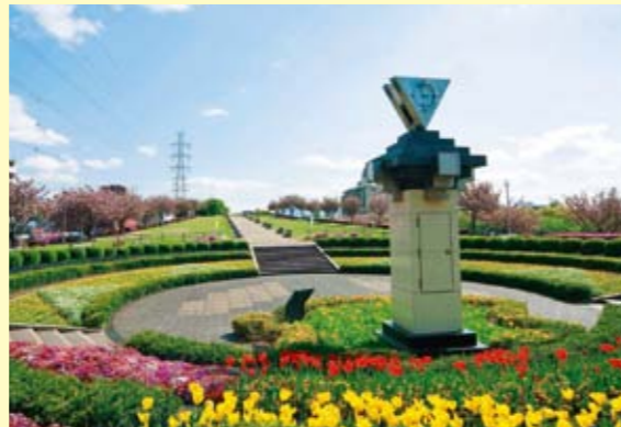
21年度 「おおいた景観モデル賞」の一つ [平和市民公園]

24年度は市内の景観に配慮した建築物や市民参加による景観まちづくりなどを募集します。