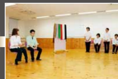
テラーの話を聞きながら、アクター(役者)の配役を決めていきます。