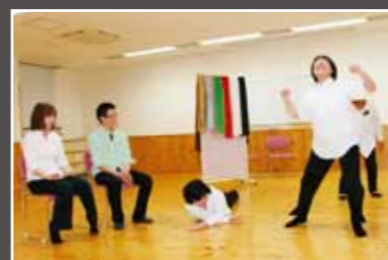
テラーの話と即興でストーリーに仕立て、演じます。

※見学を希望する人は、電話またはEメールで、練習日の2日前までに子育て支援課(☎537-5675 ■kosodatesien1@city.oita.oita.jp)へ。