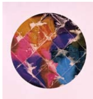
「散種あるいは《月研ぎ》V」 1991~92年(大分市美術館蔵)