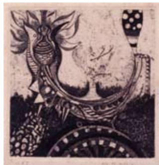
「Untitled No.4」 1957年(大分市美術館蔵)