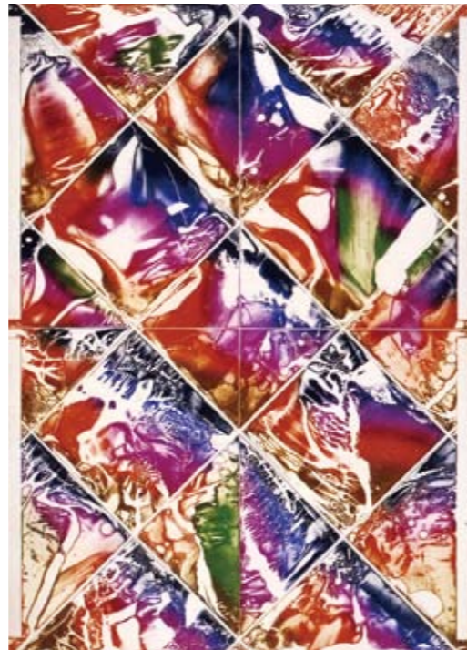
「波動説 intaglioをめぐる No.28」1985年(大分市美術館蔵)

本展では、モノクロームの銅版画、鮮烈な色彩のメタルプリント、色彩のゆらめきを捉えたリトグラフなど約70点を展示し、その変化に満ちた版画表現の歩みを紹介します。