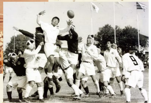
▲ラグビー(現在の駄ノ原自由広場)