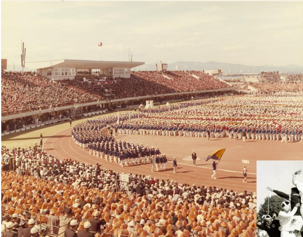
▲国体に先駆け、1965(昭和40)年7月に新設された大分市営陸上競技場での開会式

企画・発行 大分市企画部広聴広報課 (〒870-8504 荷揚町2番31号 代表 ☎534-6111)