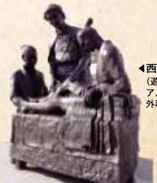
◀西洋医学発祥記念像(遊歩公園) アルメイダが日本人助手とともに外科手術を始めようとする姿