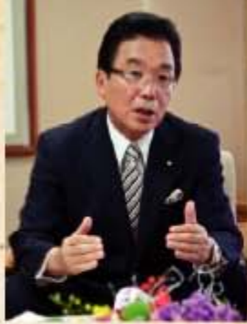
釘宮 馨 大分市長