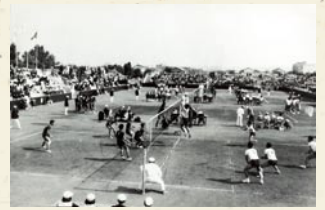
▲バレーボール (現在の駄ノ原テニスコート)