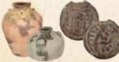
◀陶磁器(左:市教育委員会蔵)とキリシタン遺物のメダイ(右:県教育庁埋蔵文化財センター蔵)南蛮貿易によってもたらされた中国(明)や東南アジア産の膨大な量の陶磁器とともにキリシタン遺物であるロザリオ・メダイなどが出土。陶磁器の多くは火災にあっており、1586(天正14)年の島津氏による府内侵攻で町が焼き払われたことを物語っている。