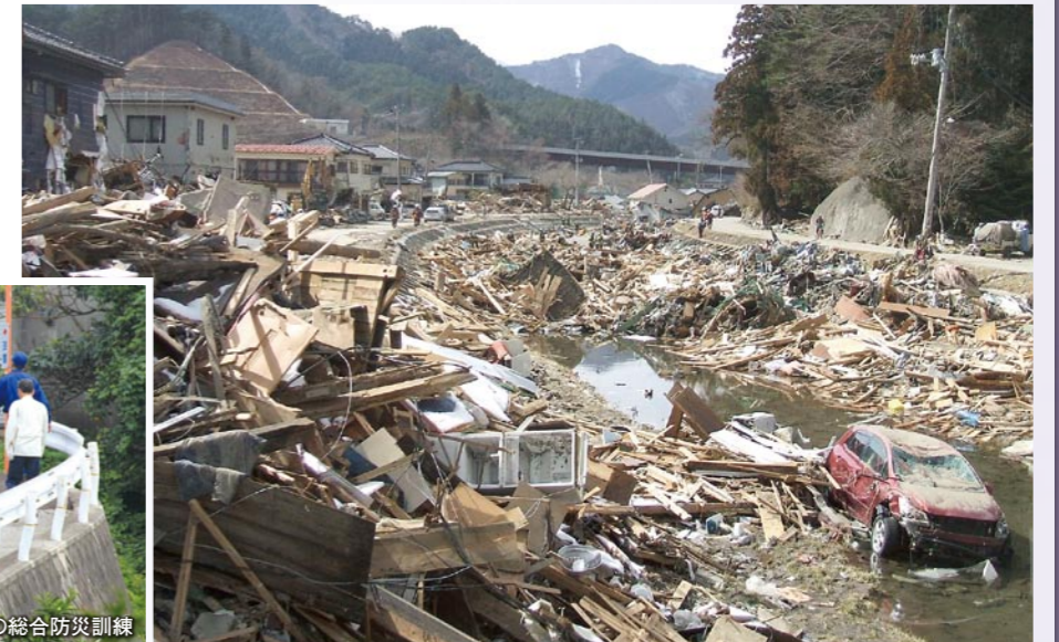
佐賀関白木浜区・白木奥区防災会の総合防災訓練

3月11日に発生した「東日本大震災」を教訓に、市内各地でも津波を想定した防災訓練が実施され、多くの住民が参加しました。