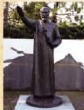
◀聖フランシスコ・ザビエル像(大手公園) 1551(天文20)年に大友宗麟に布教を許され、人々を指導する姿