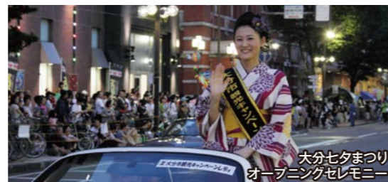
大分七夕まつり オープニングセレモニー