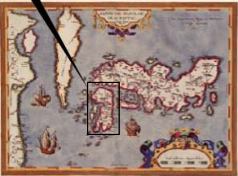
◀日本図(歴史資料館蔵) イエズス会士でポルトガルの地図製作者ルイス・ティセラによる日本単体図。九州は「BVNGO」(豊後)と記されている。