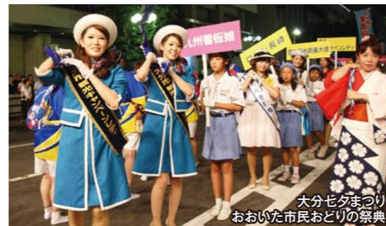
大分七夕まつり おおいた市民おどりの祭典