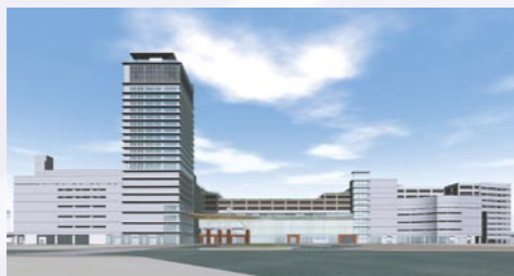
JR大分駅ビルの完成予想図

商業専門店やシネマコンプレックス（複合型映画館）、ホテルなどが入る新しい「JR大分駅ビル」は、2012年度に着工、2015年春のオープン予定です。