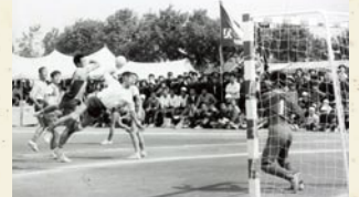
▲ハンドボール (県立大分鶴崎高校グラウンド)