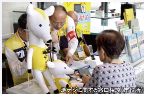
地デジに関する窓口相談（市役所）

1953年に始まったテレビのアナログ放送が、約60年の歴史に終止符を打ち地上デジタル放送になりました。