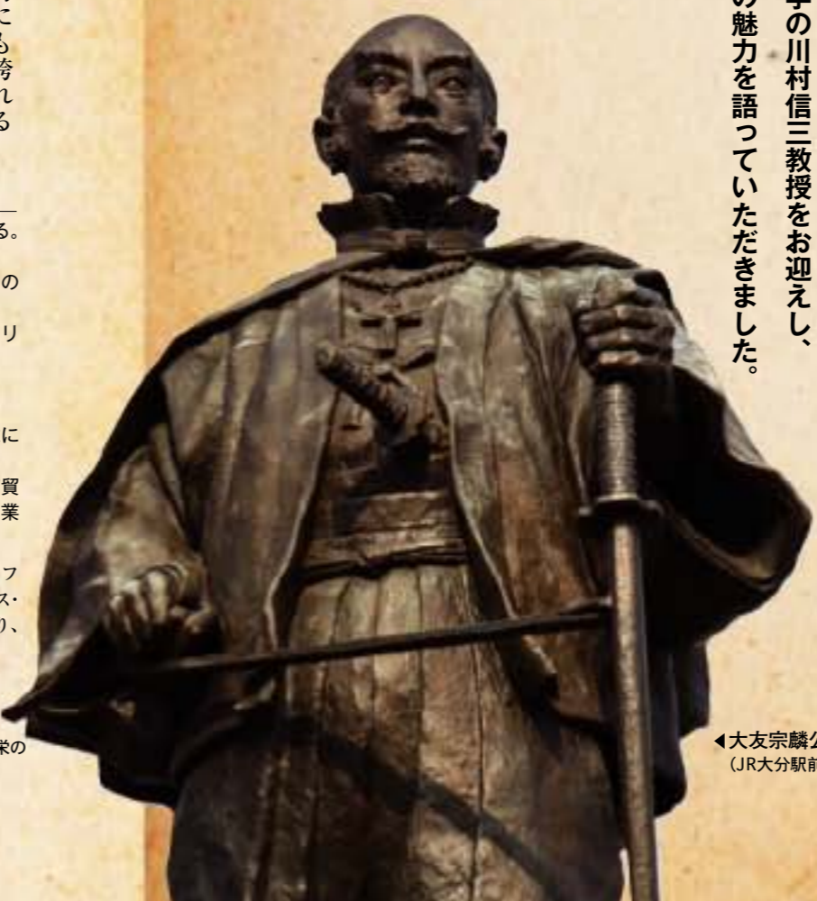
大友宗麟公像 (JR大分駅前)

市制誕生100年を迎えた大分市。 2012年を次の100年に向けたまちづくりのスタートの年とし、大分市を全国にアピールする歴史上の人物として浮上るのが「大友宗麟公」。 今回の新春座談会は大友宗麟に造詣の深い上智大学の川村信三教授をお迎えし、「宗麟」の魅力を語っていただきました。