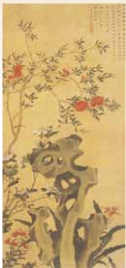
「四季花鳥図(第3図)」1809年 (大分市美術館蔵 重要文化財)