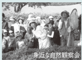
身近な自然観察会

●環境展、環境ボスター展、身近な自然観察会、エコクッキング観察会、エコクッキング講習会、子どもエコクラブ事業、環境教育副読本「わたしたちと環境」の作成、環境出前講座などを実施