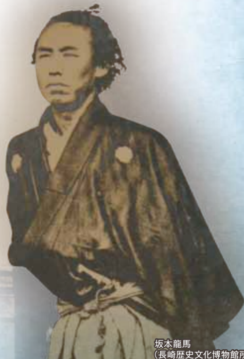
坂本龍馬 (長崎歴史文化博物館所蔵)