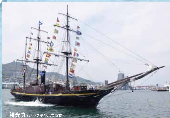
観光丸(ハウステンボス所有)

1855(安政2)年、長崎海軍伝習所練習艦としてオランダから江戸幕府へ贈呈された軍艦で日本初の蒸気帆船。現在の観光丸は、当時の設計図を基に忠実に再現された復元船。(全長65.8m、全幅14.5m、メインマストの高さ32m)