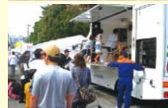
地震体験車による地震体験