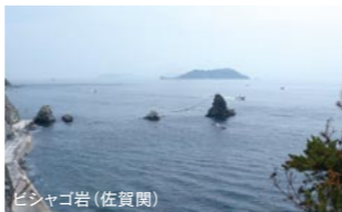
ヒシヤゴ岩(佐賀関)