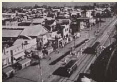
▲昭和25年頃の中央通り

また、市街地にある寺院の墓地を撤去して新しく造成した墓地公園へ移転・統合し、さらに市街地の中に新しく公園を設けるとともに、駅前にも広場を新設し、上水道を拡充整備するといったものでした。