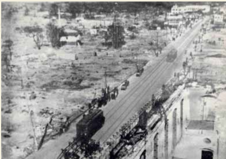
▲大空襲直後の電車通り(中央通り)

23年4月1日に旧大分市市制施行100周年を迎えた大分市。その100年の歴史を振り返り、当時の主な出来事をシリーズで紹介します。