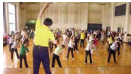
ラジオ体操・みんなの体操指導者養成講座

価をいただきました。 また、8月7日(日)に乙津川水辺の楽校で開催されるラジオ体操・みんなの体操会をはじめ、市内各所で年間を通してラジオ体操会が行われるようになるなど、その輪は大きく広がっています。 今回育った指導者が今後、ラジオ体操の普及にさらなるご尽力をいただけるよう期待しています。