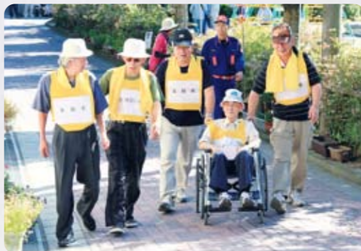
自主防災組織の総合防災訓練