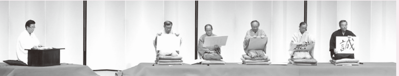
歳末たすけあい興行チャリティーショー