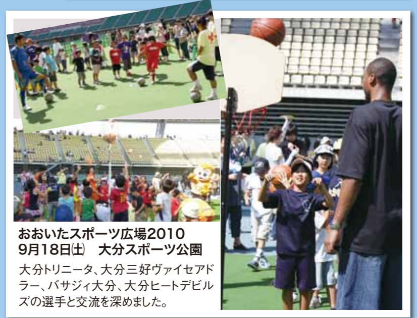
おおいたスポーツ広場2010 9月18日(土) 大分スポーツ公園 大分トリニータ、大分三好ヴァイセアドラー、バサジィ大分、大分ヒートデビルズの選手と交流を深めました。