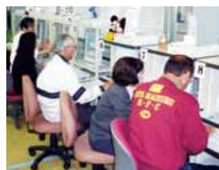
パソコン学習コーナー