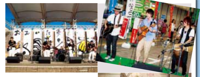
おおいた夢色音楽祭2010 10月9日(土)・10日(日) 若草公園ほか 中心市街地の公園や商店街がストリートステージに変身し、さまざまなジャンルの音楽が演奏されました。