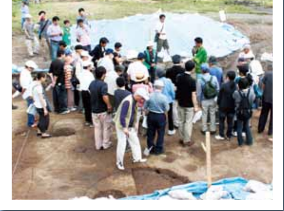
大友氏遺跡フェスタ2010 10月2日(土)・3日(日) 大友氏遺跡ほか 大友氏遺跡の発掘現場の見学や説明会で、参加者は往時に思いをはせました。