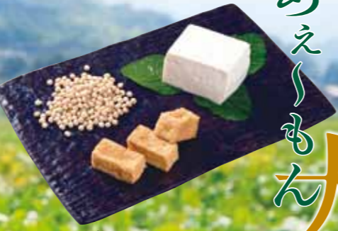
木佐上地区でとれた大豆(フクユタカ)から作った豆腐と厚揚げ

この大豆を原料にした風味豊かな豆腐も地元の人たちの手によって作られています。たんぱく質や炭水化物、脂質、ミネラルなどをバランスよく含んだ大豆加工食品。さあ、今夜の食卓に取り入れてください。