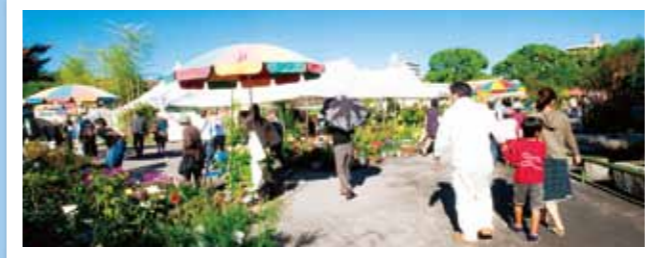
第44回大分生活文化展 10月1日(金)～11日(月) 大分城址公園ほか 植木造園展や大分市工業展、暮らしフェスタなどが行われ多くの人が訪れました。