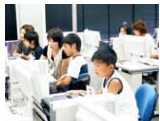
子どもパソコン教室

休 館 日/毎週月曜日(祝日・休日の場合はその翌日) ※第1月曜日は開館し、翌日の火曜日が休館、祝日・休日(日曜日の場合は開館)、年末年始(12月28日～1月4日)、その他館内整理日 開館時間/午前9時～午後10時(日曜日は午後5時まで)