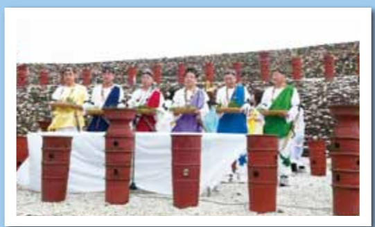
海部のまつり2010 10月24日(日) 亀塚古墳公園 古代色豊かに「登高の儀」などの儀式が行われました。