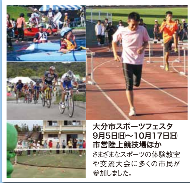
大分市スポーツフェスタ 9月5日(日)～10月17日(日) 市営陸上競技場ほか さまざまなスポーツの体験教室や交流大会に多くの市民が参加しました。