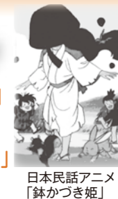
日本民話アニメ「鉢かづき姫」