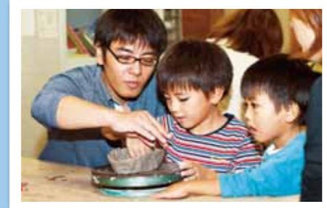
陶芸祭2010 10月24日(日) 河原内陶芸楽習館ほか 絵付け・作陶体験コーナーには親子で挑戦する参加者もいました。