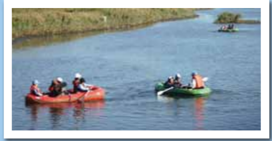
ゴムボート教室 10月17日(日) 乙津川「水辺の楽校」 ※乙津川「水辺の楽校」は七瀬川自然公園とともに国土交通省が実施した第3回「川の通信簿」で、最高評価の五つ星を獲得しました。