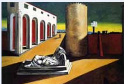
サルバドール・ダリ「イタリア広場・アリアドネーの目覚め」1970年代 © SIAE, Roma&SPDA, Tokyo, 2010