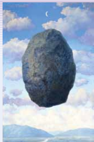
ルネ・マグリット「現実の感覚」1963年

本展では、ロワ、キリコ、マン・レイ、マグリットなどシュルレアリスムを代表する画家たちの作品を紹介するとともに、同じ時代を生きたシニャック、ポナール、ピカソ、マティスなど巨匠たちの作品を展示します。