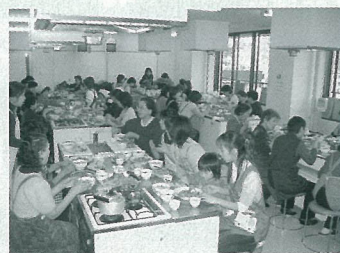
エコ・クッキング講習会

また、節電、節水、リサイクルなど日常生活における地球温暖化防止に向けた取り組みの一環としてエコ・クッキング講習会を実施しました。