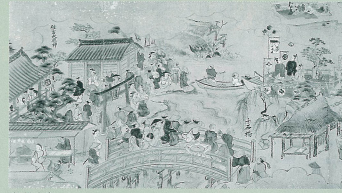
御城下絵図(市指定文化財)

テーマ展では、絵巻や城絵図・村絵図・社寺図などの絵図を通して、在りし昔の大分の様子や歴史を紹介します。