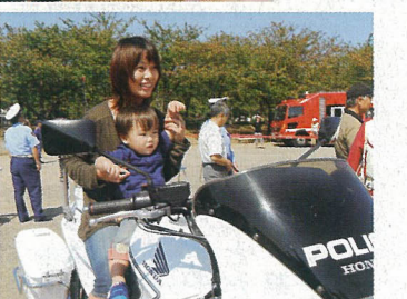
「動物愛護週間」「秋の全国交通安全運動」にちなんで楽しいイベントが開催されました。