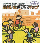
都市交通対策課、1階案内所にてお渡ししています。

まち全体が美術館のような市中心部。芸術の秋にふさわしいこのルートに出掛けてみませんか。