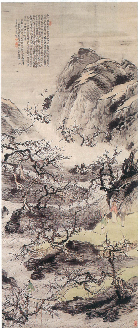
黄昏の淡い月影に照らされた、満開の梅林。白梅のかぐわしい香りが漂うなか、悠然とたたずむ人物は、梅をこよなく愛した中国宋時代の詩人・林和靖です。

天保2年冬、別府へ入湯に出かけた田能村竹田は上人仲町に住む荒金呉石の梅園を訪ねた折、その美しさに触発され、本図を描きました。梅樹や山岳を描き出す力強い運筆や、人物に施された繊細な描線、彩色など、竹田の充実した多彩な筆力が発揮されています。