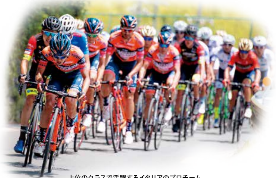
上位のクラスで活躍するイタリアのプロチーム「NIPPO・ヴィーニファンティーニ・ヨーロッパオヴィーニ」も参戦!