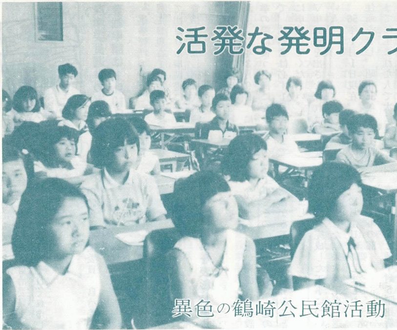
異色の鶴崎公民館活動