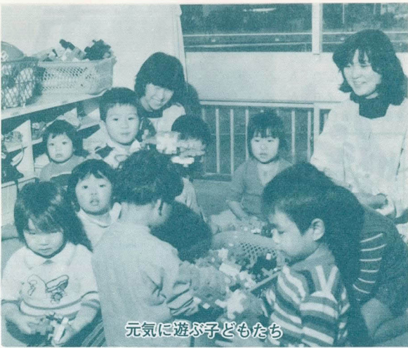
元気に遊ぶ子どもたち

集団保育になじむ軽度の心身障害の子どもたちが安心して保育を受けられるように、55年4月から住吉保育所で障害児保育を始めました。この障害児保育をより効果的に行い、保護者が安心して子どもを保育所に預けることができよう保育者たち