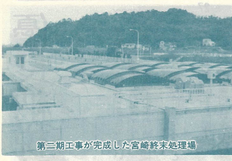
第三期工事が完成した宮崎終末処理場

宮崎終末処理場は、大分川の水質保全と植田地区の環境整備を図る目的で、47年に第一期工事（一日処理量1万3千8百立方、処理人口2万人）に着手し、48年12月完成しました。が、その後の住宅団地の開発、市内中心部からの高校移転、大分医科大の開校などにより、汚水量は急速に増加しています。このため、53年から3カ年計画で工費13億5千7百万円を投じ、第二期工事（一日処理量1万3千8百立方、処理人口2