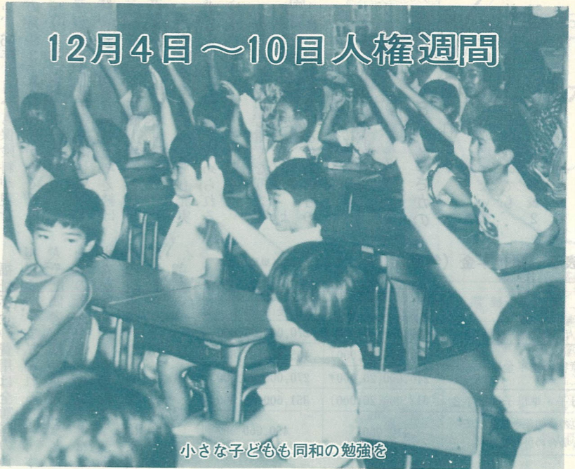
小さな子どもも同和の勉強を

あなたの家庭では、テストの点数だけで、子どもの値打ちを決めていませんか。頭ごなしにしかってみても決して子どもは