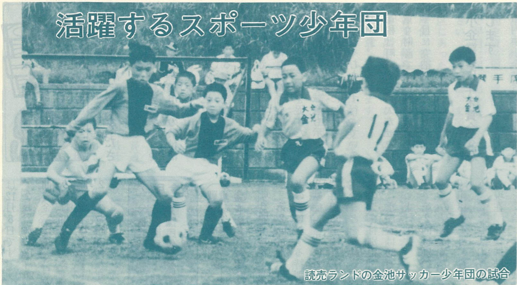
読売ランドの金池サッカー少年団の試合

スポーツ少年団は、スポーツやその他の活動をおして、健康なからだや心を養い、次代を担うりっぱな人間をつくるために生まれたものです。