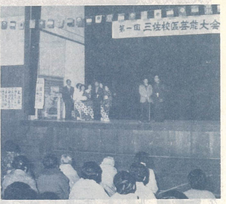
△盛況だった三佐校区芸能大会

3月16日昭電体育館で三佐校区芸能大会が行われました。これは三佐校区ふるさとづくり推進協議会などの主催で、今年初めて行われたもの。会場に集まった500人を超す観客は、謡曲、詩吟、民謡など34の出しものに熱烈的な拍手を送っていました。