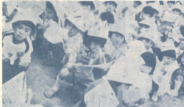
八幡小学校のこいのぼり集会

八幡小学校のこいのぼり集会。お母さんへお話しします。集団生活でみじめな思いをするだけ、知能や身体の発育もおくれがちです。自分で着たりぬいだりできるように、衣服は単純で、じょうずなものを選び、お母さんへお話しします。