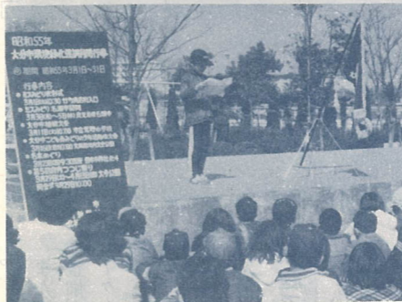
△みんなでつくろう 花と緑の明るいまち

3月16日昭電体育館で三佐校区芸能大会が行われました。これは三佐校区ふるさとづくり推進協議会などの主催で、今年初めて行われたもの。会場に集まった500人を超す観客は、謡曲、詩吟、民謡など34の出しものに熱烈的な拍手を送っていました。