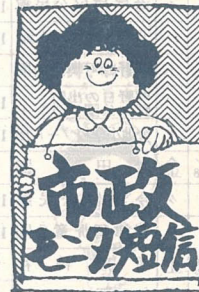
市民全体が手をつなぎあってより住みよいまちに