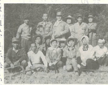
丹生地区官行造林組合 丹生地区官行造林面積百56ヘクタールのうち、組合経営面積97ヘクタールに杉と桧約28万5千本を植え、以来下刈り防除など管理面に積極的取り組み、また、松くい虫による被害林の更正についても県、市に積極的に協力し、熊本営林局からも高く評価されています。さらに、九六位山に通ずる観光道路も開発、地区内の公共事業については、事業費の一部を振興会を通じて寄付するなど、造林思想の普及に大きく寄与されています。

文化 鶴崎おどり保存会 4百年の歴史をもつお受け継がれた鶴崎おどりを、永久に保存しようとして、大正12年、本場鶴崎おどり保存会が組織され、