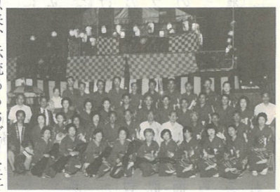
文化 鶴崎おどり保存会 4百年の歴史をもつお受け継がれた鶴崎おどりを、永久に保存しようとして、大正12年、本場鶴崎おどり保存会が組織され、