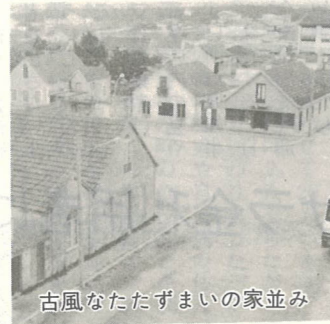
古風なたたずまいの家並み

非常に明るく物事にくつたくなのが特徴のようで、駐日ポルトガル大使の話によればアベイロ地方の方々はその中でも特に大人だということだった。 ポルトガルは、昭和49年に政治体制の改変をしたこともあり、指導者が若く、アベイロ市においても、市長が38歳、副市長は女性で41歳と若く、今後の発展が期待されることである。 給与水準は、日本円換算で4万円弱と低位である一方、食料品を中心とした物価水準が低いので、生活はしやすいようだった。