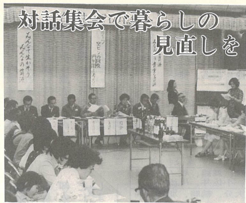
対話集会で暮らしの見直しを