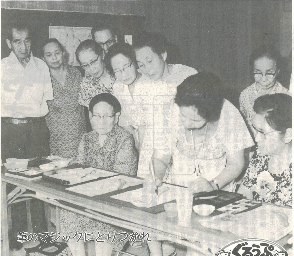
筆のマジックにとりつかれ