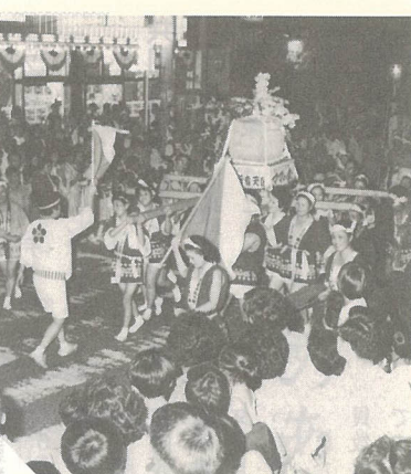
▽盛大に大分市芸能文化祭

第27回大分市芸能文化祭が、8月27日に大分文化会館で盛大に開かれました。この芸能文化祭も回を重ねるごとに盛りあがりを見せ、日頃の練習の成果を披露していました。