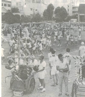
▽ユニークなまつり、中島校区ふるさとづくりフェスティバル

府内町子ども会の15人は夏休み期間中、朝のラジオ体操終了後に週2回、歩道橋などの清掃を行いました。