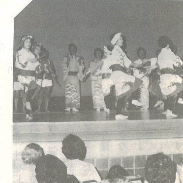
▽ユニークなまつり、中島校区ふるさとづくりフェスティバル

第27回大分市芸能文化祭が、8月27日に大分文化会館で盛大に開かれました。この芸能文化祭も回を重ねるごとに盛りあがりを見せ、日頃の練習の成果を披露していました。