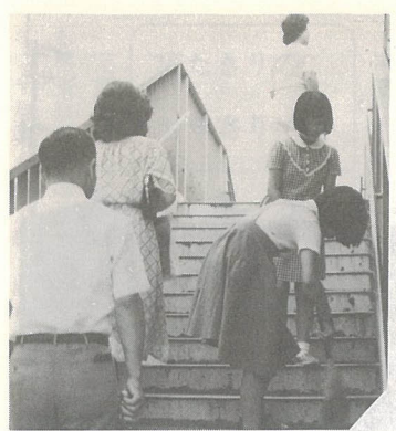
△わたしたちで町をきれいに

下げやローカル線の充実、バスの案内や応対の態度、乗降者の確認などについて担当者と話しました。