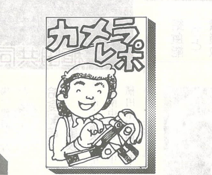
▽盛大に大分市芸能文化祭

中央通りを歩行者天国にして▷大分のまつり "33万人の顔。" 8月26日、市中心街で大分のまつり33万人の顔が行われました。