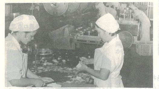
心をこめて給食づくり

給食配送対象校 市立南大分中、城南中、賀来中、植田中、植田西中の計5校です。 給食能力と職員数 5千食を最高能力とし、発足当初は3千3百86食です。ターゲットとしています。また、職員数は18名です。 構造と規模及び工期 構造は鉄骨造り平家建て、建築面積は6百76・42平方メートル。工期は52年12月～53年6月30日。 ご飯給食も週1回に増えました 4月から市内の小、中、養護学校でいっせいに給食給食を始めたので、 一学期間は、月2回の割合で実施し、その後給食関係者の意見を聞きまし。パンに比べご飯は、配膳に時間がかかる。はしを忘れて指導に困る。食器の汚れがおちにくい。ゆとりある給食時間にしてほしい。などさまざまな意見が出されました。しかし、一般的に児童、生徒には大変好評なため2学期からご飯給食日を週1回に増やすことになりました。 なお、今後はアンケート調査などし、ご飯給食をより楽しく、おいしいものにしていきます。