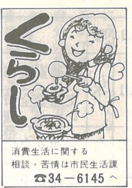
消費生活に関する相談・苦情は市民生活課 ☎34-6145

クリーニングで背広のスポンを紛失されたときは： (問) 昭和51年7月に7万円位で買った背広のスポンをクリーニングに出したら紛失されてしまいました。