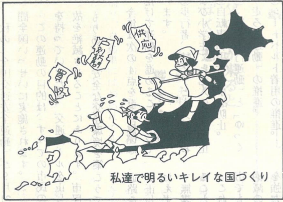
私達で明るいキレイな国づくり