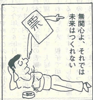
無関心よ、それでは未来はつけない

すでに市選管から交付をうけている「郵便投票証明書」を添えて、9月22日までに、投票用紙等を請求しなければ投票ができません。ご注意ください。