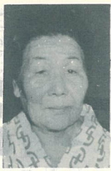
目3町丁 3丁目 森崎 碩田

若いときから謡曲をやっていたんです。ところが7年前におじいちゃんが病気で倒れてすつとやめられました。