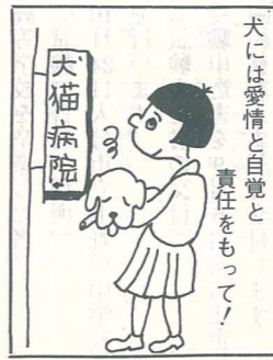
犬には愛情と自覚と責任をもって！

上で共存することができるようにするのが人間の幸せであり動物の幸せでもあります。 動物の飼育者は動物の習性を理解し、その習性に合った正しい飼い方をし、動物に不必要な苦しみを与えないように、又他人に迷惑をかけないように適正な管理を心がけましょう。 （環境衛生課・内線285）