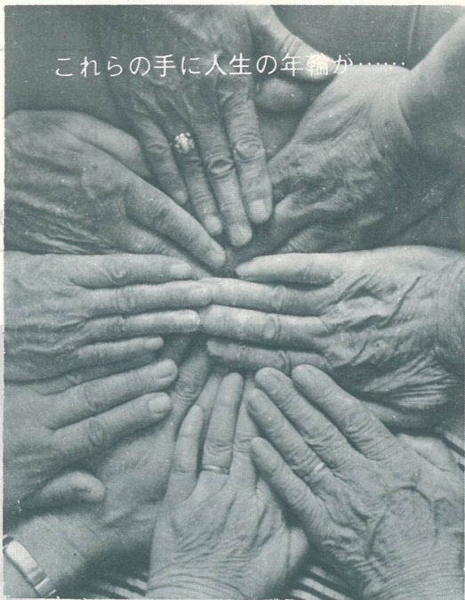
これらの手に人生の年輪が...

そこで、今回は敬老の日行事とともにお年寄りのための福祉制度も紹介しましたのでご活用下さい。