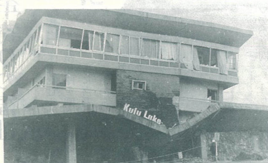
50年4月地震で崩れたホテル(湯布院町)

えについて、もう一度点検し、避難する場合、どの道を通ってどこに行くかなど災害対策について話し合ひましょう。