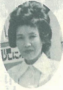
くらしの工夫・趣味・ 白慢話などは、このコ ーナーに。