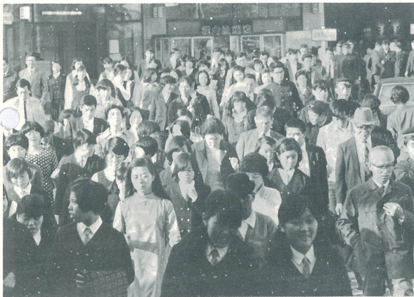
みんなで築く明日の大分

道路、下水、公園、ゴミ処理——みなさんが毎日生活していくうえで欠かすことのできない生活環境施設です。 これらの施設や市民福祉、教育文化等をさらに充実させ、明るく住みよいまちづくりを計画的に進めるための「大分市総合計画」を市民のみなさんと共につくることにしました。 そこで今回は、この総合計画が、どのような方法で作られるのかを説明して、みなさんのご協力を得たいと思います。