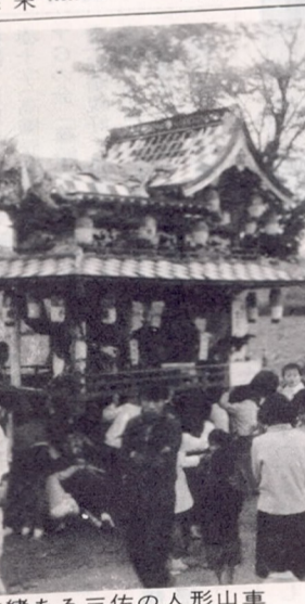
由緒ある三佐の人形山車

西一日児童公園前(循環) ⑤ 明野一丁目 仲西橋一丁目 向原一丁目 高城駅前 萩原一丁目 護国神社前 東原 明野(右廻り、左廻りで循環) 詳しくは新日鉄大分製鉄所庶務課(☎1313)までお問合わせ下さい。