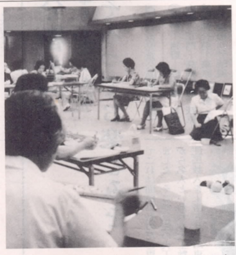
腕もめきめき上達（昨年夏の芸術講座で）

市美展は、こうした市民の学習発表の場と鑑賞の機会として昭和四十一年大分国体を契機に発足し、十一年を経過した現在、すっかり市民になじみ深いものになり、創作意欲の励みにもなっています。