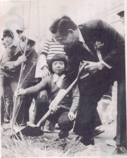
(柞原参道を桜の名所に) 柞原神社の参道に昔ながらの桜並木を...と3月5日、現地にて桜並木植樹祭が行われました。市長をはじめ地元自治会のみならず小学生など約120人が参加し、4畝にわたって桜の苗木200本を植えました。

(お年寄りの学芸会) 3月2日、市社会福祉センターで、しわのぼし老人学級生の学芸会が行われました。この一年間楽しながら学んだ踊りや隠し芸などが披露され、集まった百20人のお年寄りが楽しいひとときを過ごしていました。