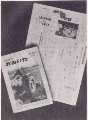
スタイル一新 読みやすい冊子型に

四月十五日号の市報から、市報の内容、スタイルが変わります。大分市報は、昭和二十四年五月二十日に第一号が発行されて以来、市の施策の紹介や市からのお知らせを中心に市役所と市民の間を結ぶかたちとして重要なパイプ役をはたしてまいりました。