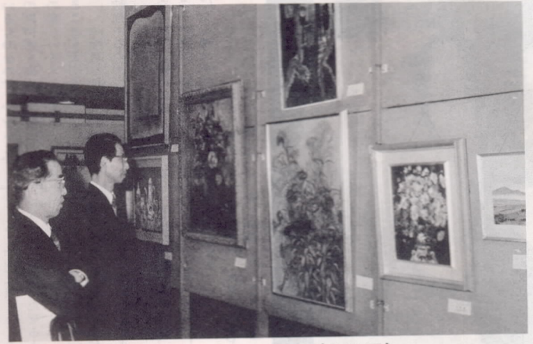
日頃の成果が一堂に（市美展）

社会教育の場を通じて、一人でも多くの市民の方に社会参加していただくこと、過去三回にわたってこの欄で大分市の社会教育活動について紹介してきましたが、今回は社会教育特集の最終回として、本市における芸術文化活動とらあけてみました。