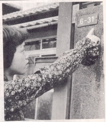
住居表示板は大変便利です

分のレセプトを整理のうえ2月上旬に県国保連合会に医療費を申請するのうえ、国民健康保険課又は支所市民係までお届け下さい。 連合会では、県下各医療機関からのレセプトを集計し、審査点検のうえ、これを各市町村ごとに分類し、3月上旬に各市町村に請求してきます。