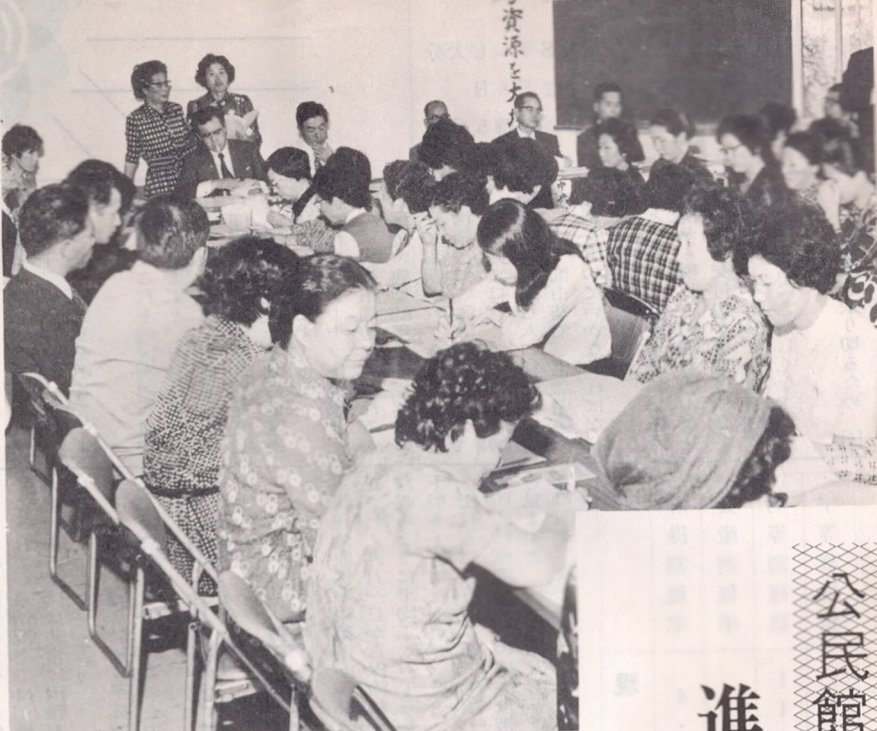
限りある資源をどう活用するかを話し合っている。