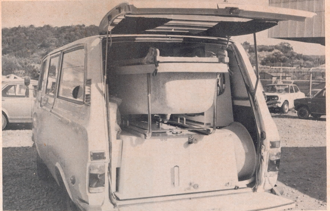
「さわやか」と同じ型の入浴サービス車