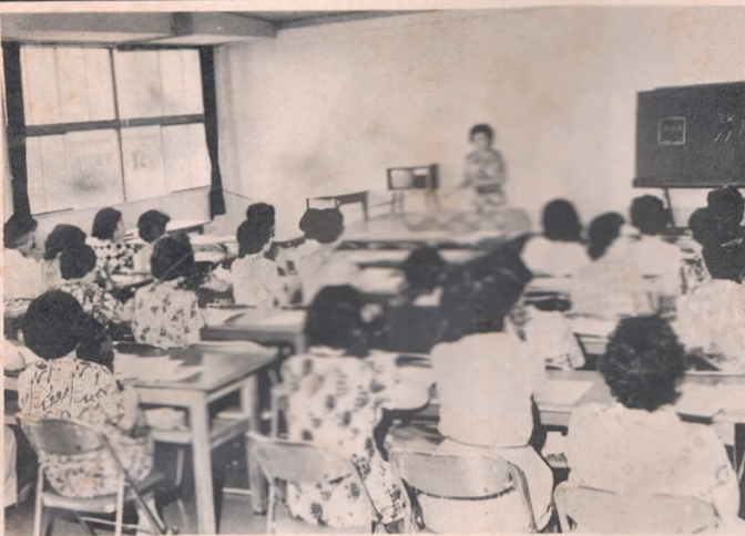
かしこい消費者になるために (種田地区消費生活教室)

この消費生活教室は、市民のみなさんに消費生活に関するいろいろな情報を提供するとともに、日頃消費生活を送る上で生じる種々の問題について、それぞれの専門家を講師にまねき、お互いに意見を交換しながら学習する場です。 昭和四十五年に開校して以来開校校も十八を数え、受講者も延べ四千二百人に達しています。 テーマは、消費生活に関するものであれば経済問題から衣食住にいたるまで幅広く取り上げていますが、昨年度は物価の上昇を背景にして物価問題についての要望が多かったのにくらべ本年度は食生活の安全の確保が重要視される世相を反映して、食品の安全性についての要望が増えています。 なおこの教室には、消費生活に関する心のある方であれば誰でも参加でき、又二十名以上のグループをつくれれば教室を開くこともできます。 日々変化する消費生活に対処するため新しい知識や疑問を持ちやすい賢い消費者になるための学習の場として活用していただきたいと思います。参加ご希望の方は市商工課までご連絡下さい。