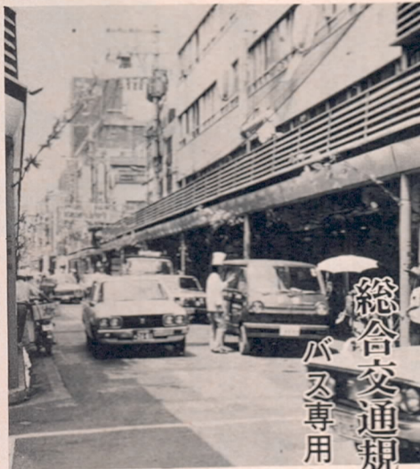
総合交通規制を実施 バス専用レーン等を設置

大分市移動図書館がいよいよ八月中旬から動き始めます。現在、大分市には県立図書館がひとつあるだけで、郊外の人たちはなかなか利用しにくい状態です。このため各方面から、三十分都市大分市に市立図書館の建設を」という声があがり、市立図書館建設の前段階として、まず移動図書館を始めるわけです。 移動図書館は二十六人乗りマツダのバスを改装したもので、子どもからおとなまでの方が楽しめるように一般教養書、文学書、実用書などの新刊本約千五百冊を積載しています。 また、この移動図書館は車の外側と内側から図書を選べる両側書架方式を採用し、市民の方々が利用しやすいようにしています。 巡回場所は現在のところ、公民館や各地区の読書グループなど四十五カ所ですが、蔵書が増えるにつれて、巡回場所も多くなっていく計画です。 移動図書館は巡回場所をプロックにつけて、各プロックをそれぞれ毎月一回巡回して図書を出しします。 貸出しにはセット方式（あらかじめ図書を貸す方法で、一セットが一般教養書一千冊、文学書三百冊）と自由貸書方式（図書の中から自由に選ぶ方式）があり、原則として自由貸書方式です。 自由貸書方式では市民一人が二冊までを借りられます。蔵書数が増えるまで一人一冊の制限があります。 市民の皆さん、おおいにこの移動図書館を利用してください。なお、移動図書館についての