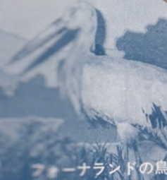
フクロナツの鳥獣 (コウノトリ)