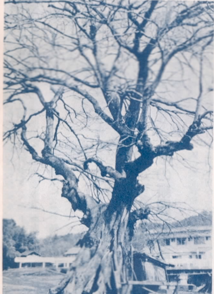
▲名木に指定された地蔵森のムク (植田地区寒田...樹齢5百年、樹高20m 周囲4.5m) お地蔵様を作った当時植えられたもので、現在、木の幹の中にお地蔵様を包み込み道行く人々が供えた四季の花が絶えません。

市ではこれらの名木の所有者及び管理者に樹木の育成管理に必要な経費の一部として名木一本につき年額七千円、樹林百㎡当たり年額七千円を助成し、又名木が枯れるおそれのあるときや伐採、譲渡する場合の届出義務など名木がいっまでも人々に