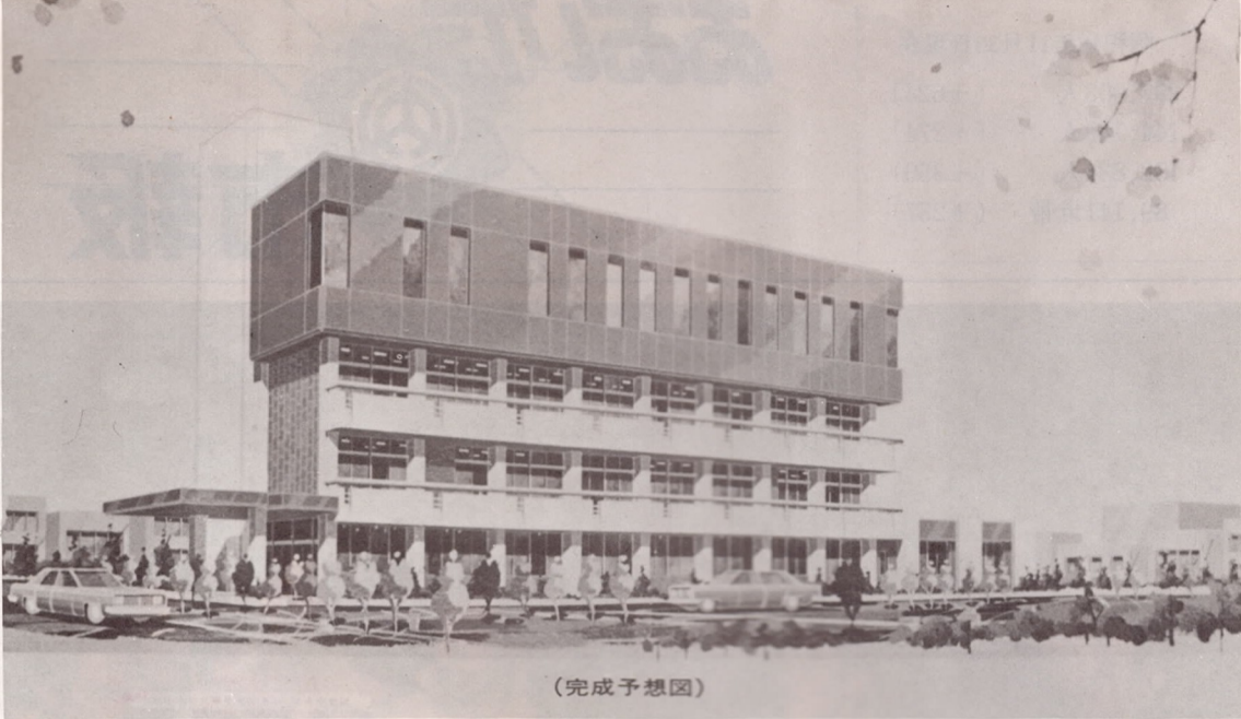
市社会福祉センター 社会福祉の充実を目指して、碩田町に市社会福祉センターの建設が進んでいます。一、二階に老人福祉、三、四階に社会福祉施設を集めることになっています。

が、市民の 場、特別立入調査を行った。 住友化学が火災を発生 住友化学が悪臭を漏洩、また火災事故も起こし、操業停止を命ず。これを機に市内全企業の防災対策をたてるべく市内の各化学工場に特別立入調査を行った。 生活環境の整備すむ し尿処理場大洲園の増設工事および宮崎公共下水道終末処理場が完成、また野津原町福宗にゴミ焼却清掃工場の建設に着手した。市民健康保持のため、大分地域保健委員会を結成、なお緑化推進を図るため市名木保存条例を制定、また市の木、市の花も定めた。 産業経済の振興 中小企業従業員に住宅資金制度を新設、中小企業者の融資枠を拡大し商工業の振興を図り、また自然遊歩道をかねた再進峠、九六位山、霊山、本宮山、高崎山の循環林道八十三キロメートルのうち既設の道路を含め七十七キロメートルが完成、農道舗装率も年度末には八十パーセントになる。 福祉施設を進む 老人福祉の充実を図るため老人憩の家を大南・坂ノ市に建設し、また老人訪問員制度に併せ消防ヘルパーを発足させ、寝たきり老人や一人暮らしの老人を見守ることにした。またその他一歳児未満の入院医療費を無料化した。 教育施設の充実 義務教育人口の増大に伴い南大分第三小学校(仮称)の新設をはじめ十四小中学校の増設を進めた。また体育施設として温水プールの建設に着手すると共に市営プールの個人使用料を無料とした。