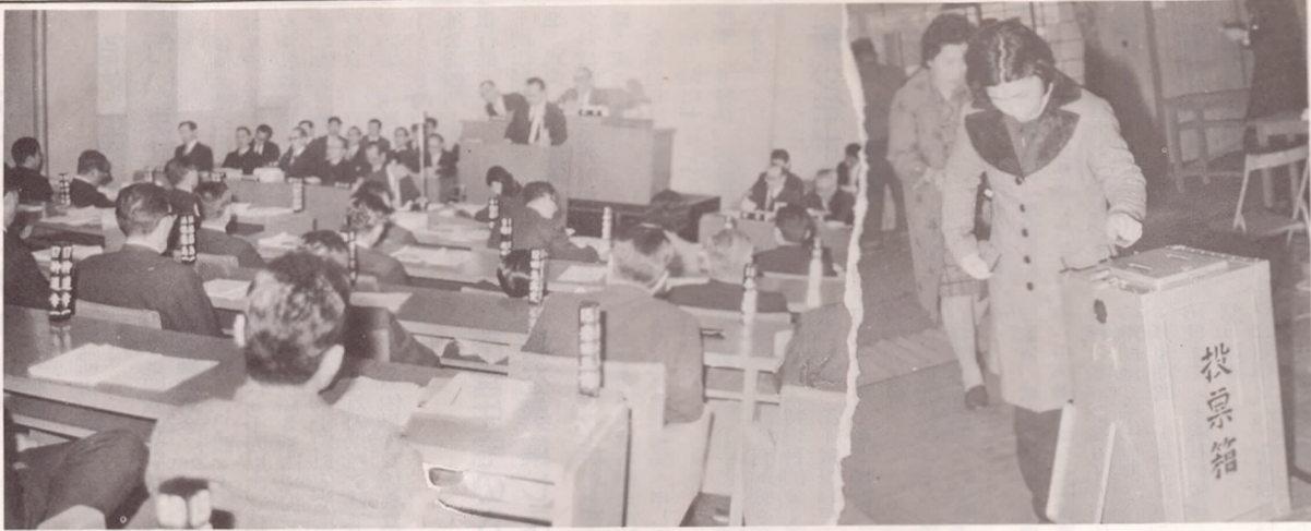
市民の代表44名決まる 市議会議員選挙の投票が2月18日に64投票所で行われ、即日開票の結果、市民の代表44名が決まりました。投票率は前回は1.34%上回る86.58%でした。

大選挙区制による新議員誕生。三十八年合併後はじめて大分市全体を一本とした大選挙区制による市議会議員選挙が二月十八日行われ新議員が誕生した。 新産都第二期計画着工。新産都都市建設に基づく第二期計画の工事が始まり、これにより新産都都市大分として初期の目的に一歩近づいた。