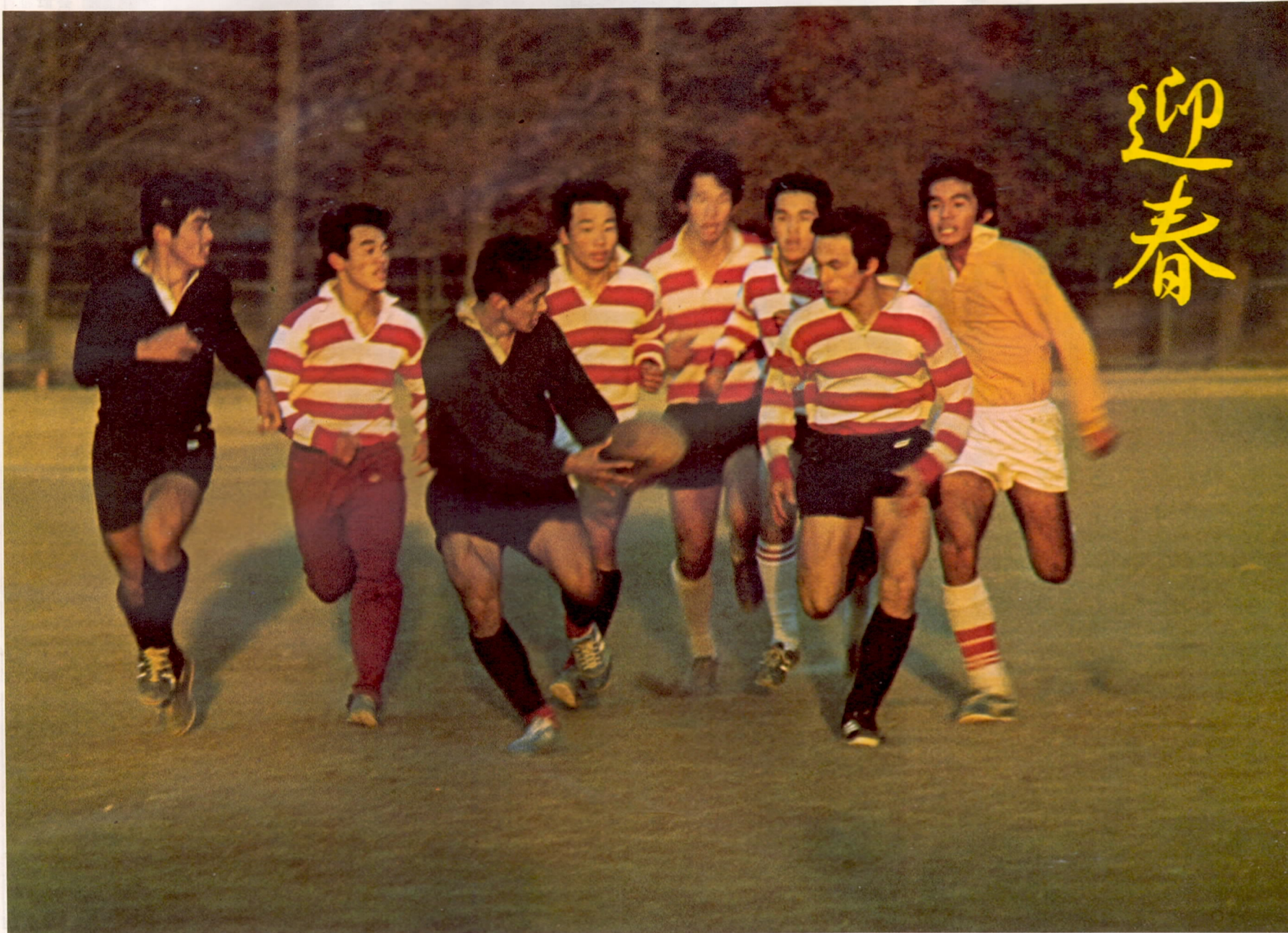
大分舞鶴高等学校ラグビー部

発行所 大分市役所 編集兼発行人 大分市役所代表者 橋本文治 印刷所 佐伯印刷株式会社 (全世帯無料配布)