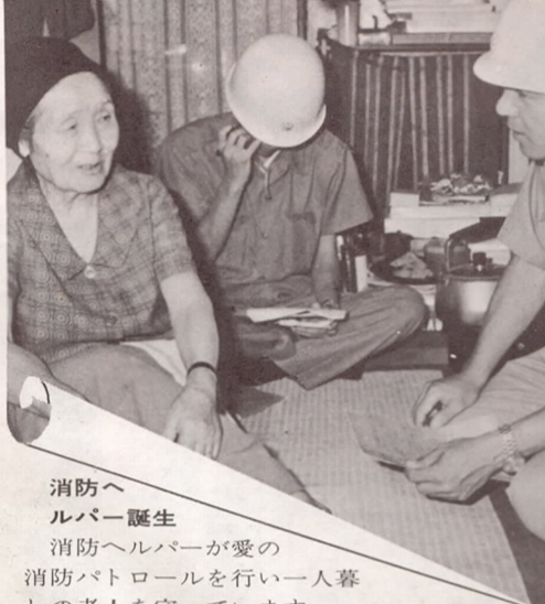
消防ヘルパー誕生 消防ヘルパーが愛の消防パトロールを行い一人暮らしの老人を守っています。