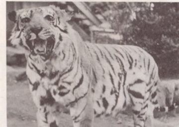
フォーナランドの鳥獣 (ト ラ) ライオンと共に昔からよく知られているアジアの猛獣である。北はシベリアから南はインド、マレーなどの森や茂みに単独ですんでおり、シカ、イノシシなどを捕えて食べます。