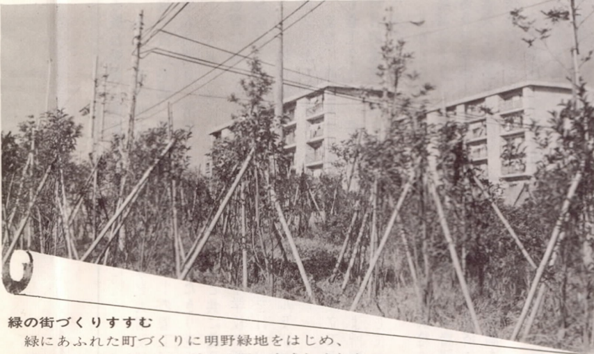
緑の街づくりすすむ 緑にあふれた町づくりに明野緑地をはじめ、市県あわせて市内に16カ所の公園が完成しました。

「シロカ」 生命力のある緑の木「ホルトノキ」が市の花に制定され、緑あふれる街づくり