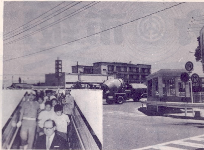
完成した中島地下横断歩道

①総所得金額等が十四万円(改正前十三万円)に被保険者(世帯主を除く一人)を八万円(改正前六万五千円)を加算した金額以下の場合...四割減額 ②減額対象者を次のように広げました。 ③所得金額等が十四万円(改正前十三万円)以下の場合...六割減額