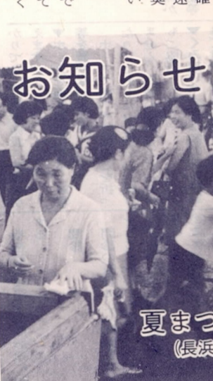
夏まつり始まる (長浜神社で昨年写す)