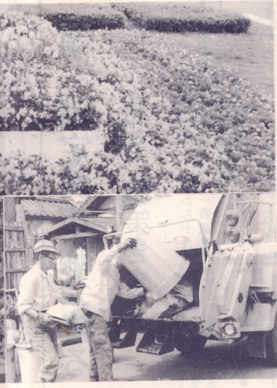
市では今年も七月十五日から八月...

衛生害虫駆除は十日に一回必ず町内全域共同駆除を実施していただきます。それができないときは町内の一部に実施すると効果があります。