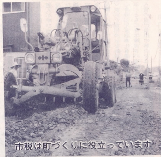
市税は町づくりに役立っています

今年度も市県民税は地方税法の一部改正で所得控除額が引き上げられ、税負担軽減がはかられています。改正された点は次の通りです。 ▽配偶者控除 十三万円(旧十一万円) ▽扶養控除 一人につき十万円(旧八万円) 配偶者がいない場合の一人目は十一万円(旧九万円) ▽障害者控除 重度障害者十一万円(旧十万円)、普通障害者九万円(旧八万円) ▽基礎控除 十四万円(旧十三万円) ▽医療費控除の限度額 百万円(旧三十万円) ▽生命保険料控除の限度額 二万七千五百円(旧二万五千円) ▽障害者、未成年者、老年者、寡婦の方は、年間所得三十五万円(旧三十万円)までは市県民税はかからないようになりました。