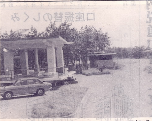
すでに整備されている部分

市では鶴崎三佐地区に造成中の松原工業公園の事業を公費防止事業に委託して、本年度から三カ年計画で完成させることになりました。