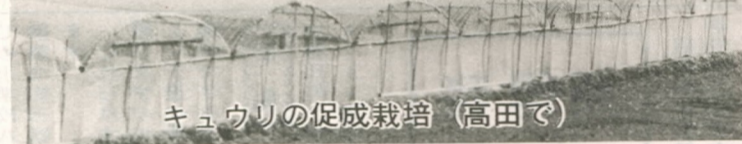
キュウリの促成栽培（高田で）

一、整備計画作成の準備 市は、まず、その地域の土地利用区分、人口、産業の動向、農業経営、農産物の流通などの現状を調査します。 次に、農用地利用の高度化をはかるため、農用地利用計画の基礎資料を作ります。 また整備計画に関係する農家の意向を反映させるため、アンケート調査を行ないます。