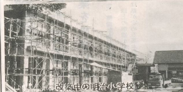
改築中の明治小学校