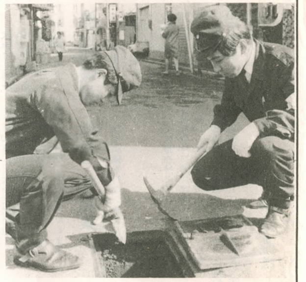
消火栓を調べる消防職員 (都町で)

もうすぐ四月、学校は新学期を迎え、初めて学校や幼稚園に通うかわいい児童や園児の姿が見受けられるようになります。また、一年進級した子どもたちの元気な通学風景も見受けられるようになります。 この子どもたちを交通事故から守るため、今年も、子どもを事故から守る運動が二月二十日から三月十一日までの二十日間、県内一斉に実施されます。 運動の重点は、とくに今年新しく入学、入園する児童園児を対象にして、現在のきびしい交通環境に順応できる教育、指導を行ないます。また、子どもをとりまく市民が、子どもを交通事故から守ることに、事前には、通学路を教えることと、安全運転運行管理をしないこととはもちろん職場における運転者に対して前記事項を徹底させるため、違反運転者に対する取締りを強力に実施します。