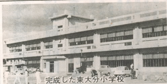
完成した東大分小学校