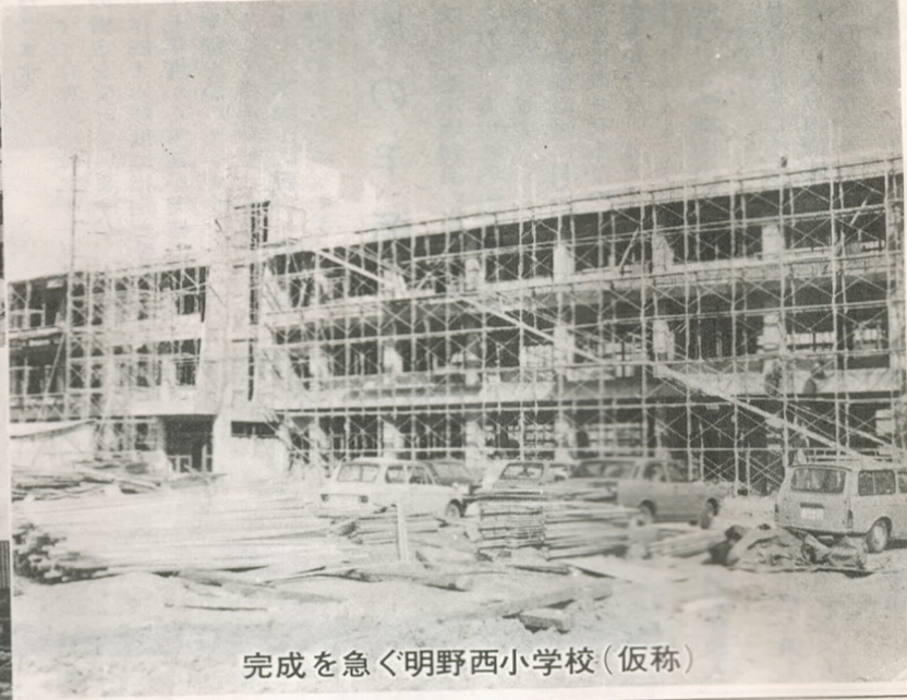
完成を急ぐ明野西小学校(仮称)