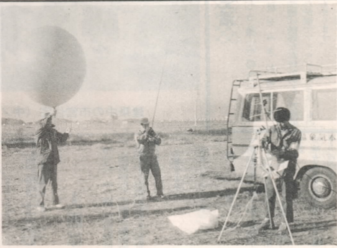
低層ゾンデを飛ばす係員 (2号地)

この観測は、大気を選んだのは、冬は夏に比べて、大気不安定で、逆転層の発生状況や季節風時に発生しやすい気象汚染(風の強いとき)に起る大気汚染の汚染(風の原因となる大気の実態をつかみ、公害対策の資料にする)です。