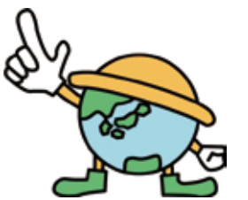
大分市地球温暖化防止キャラクター アスまるくん