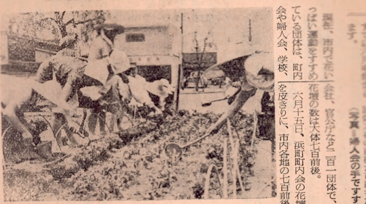
市内で花いっぱい運動が盛んな中、市民や子どもたちが花壇の整備や植栽に努めている。写真は、市内各地で行われている花壇の手入れの様子。

花壇に最後の植込み 90万本の苗 婦人会の手でいっせいに 「花いっぱい運動」の最終段階として、市内各地で行われている花壇の整備や植栽に、市内の婦人会が中心となって取り組んでいる。六月十五日、浜町町内会が主催の花壇の手入れ大会が、市内各地で行われた。この日は、市内各地の婦人会が、花壇の整備や植栽に積極的に参加し、花壇を美しく保ち、市民に楽しんでほしいと願っている。