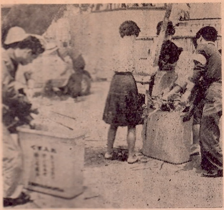
写真一頁の端を並び、ひたいに汗をにじませて活動の熱い青年友の会