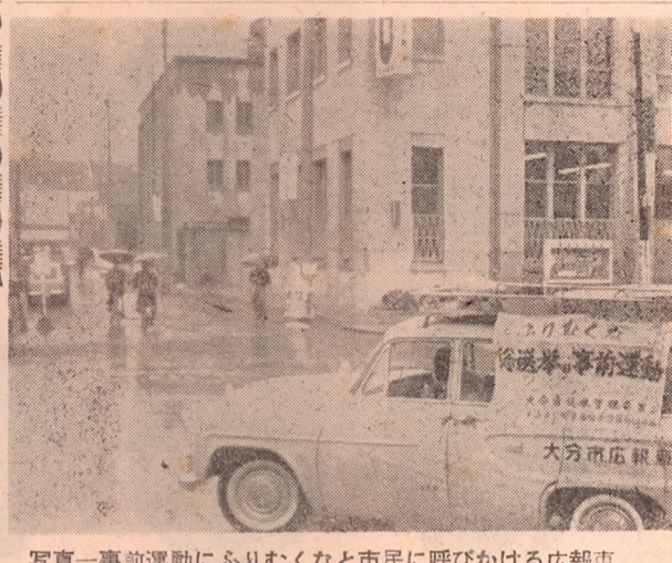
写真一 事前運動にふりむく市民に呼びかける広報車

選挙人名簿は、選挙権者としての権利を行使する者も、選挙権者としての義務を履行する者も、この選挙に備えて準備しなければならない。