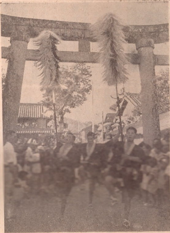
写真—7年前の大名行列

種田地区賀来神社の祭りが九月一日から十一日まで行なわれる。賀来神社の祭りは、賀来神社のまつりといわれ、賀来神社のまつりといわれる。賀来神社のまつりといわれる。賀来神社のまつりといわれる。