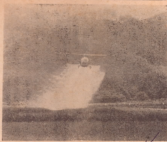
写真一ヘリコプターによる農薬散布