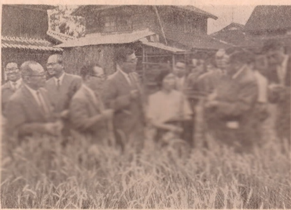
写真一長雨による麦の被害を視察する衆議院農林水産委員会の視察団