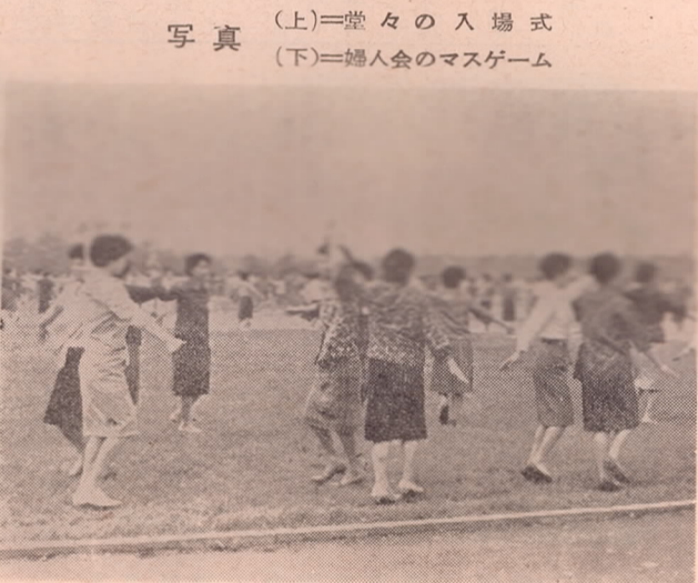
(上)一堂々の入場式 (下)婦人会のマスゲーム

五月十九日第八回市民体育大会と日本体育大会大分大会が市内御鷹の総合グラウンドで華々しく開催されました。 降り続いた雨も、この日はカラ